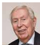
Column Anton de Man