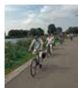
Harttrim- groep Rotterdam