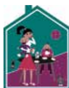
Wat hebben doordewijkers te bieden?