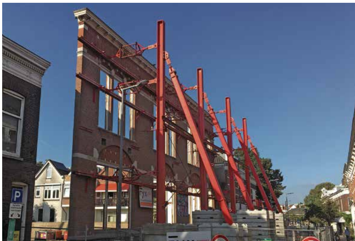
Gezien in de 2e Pijnackerstraat. Typisch voorbeeld van het Rotterdamse 'niet lullen maar poetsen'. Moet alleen de voorgevel blijven staan? Dan laten we alleen de voorgevel staan!