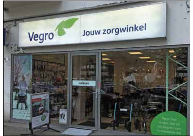
Kom langs in onze vernieuwde zorgwinkel

Maandag t/m vrijdag: 09.00-17.30 uur Zaterdag: 10.00-16.00 uur